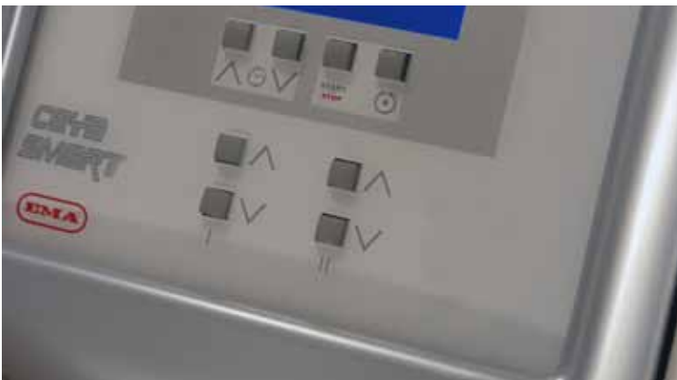
Detalle mod. CEYA 02