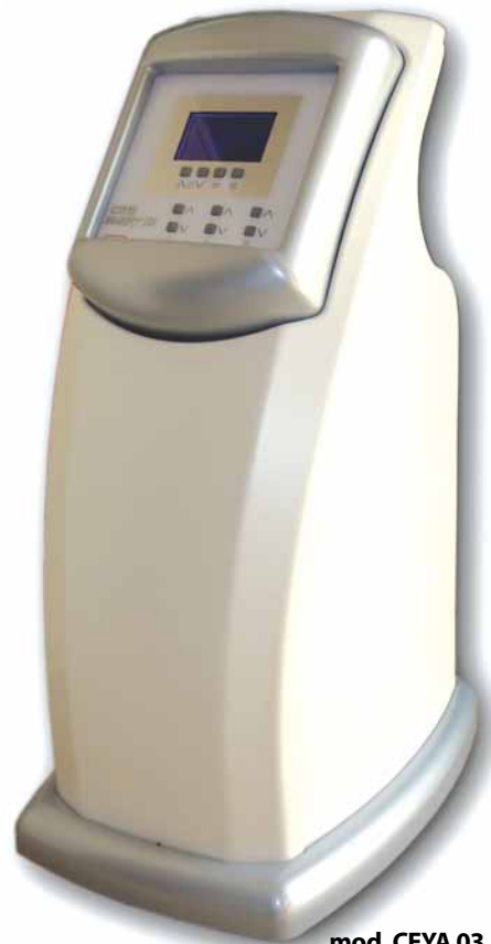
mod. CEYA 03