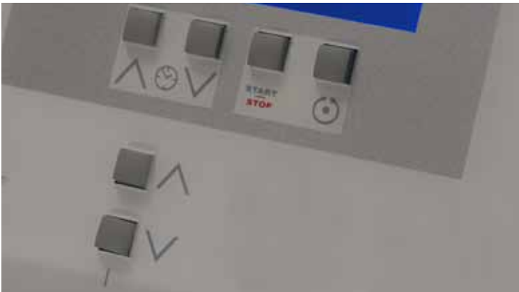
Detalle mod. CEYA 01